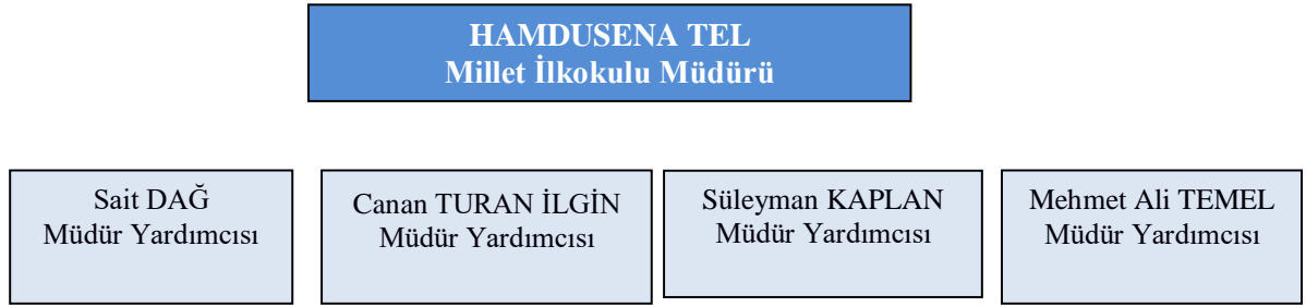
Şekil 2. Millet İlkokulu Müdürlüğü Teşkilat Yapısı

Okulumuzda 1 müdür, 4 müdür yardımcısı görev yapmaktadır.